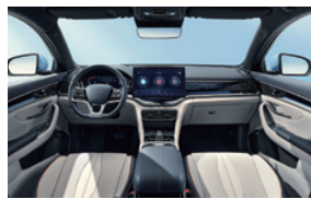
Blue and grey